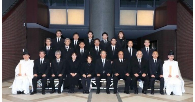
浪速学院 浪速高等学校 中学校 令和5年度 合祀祭 令和5年4月6日